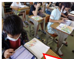
自分の思いを タブレットで表現!